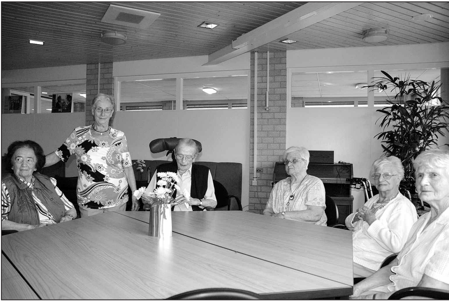
Een groep dames drinkt iedere morgen koffie in De Klipper. De vernieuwde recreatiezaal is gezelliger geworden met nieuw meubilair, echte bloemen en lichte kleuren op plafond, wanden en vloer.

Recreatiezaal en receptie zorgcentrum Ten Anker ondergaan metamorfose